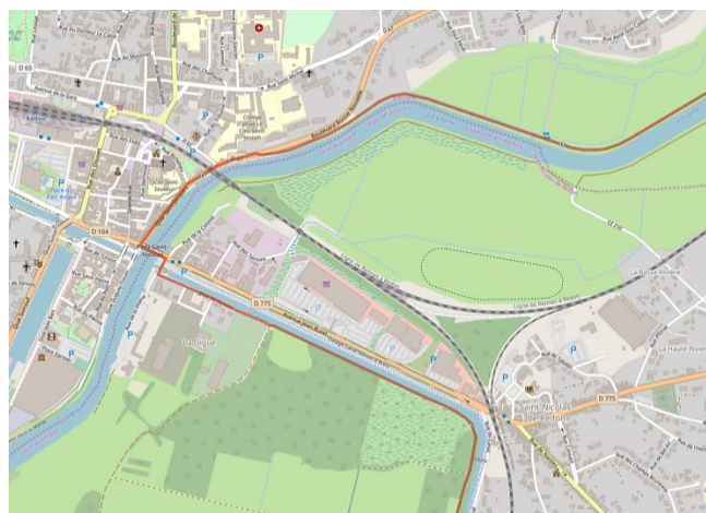
Arrivée à Redon